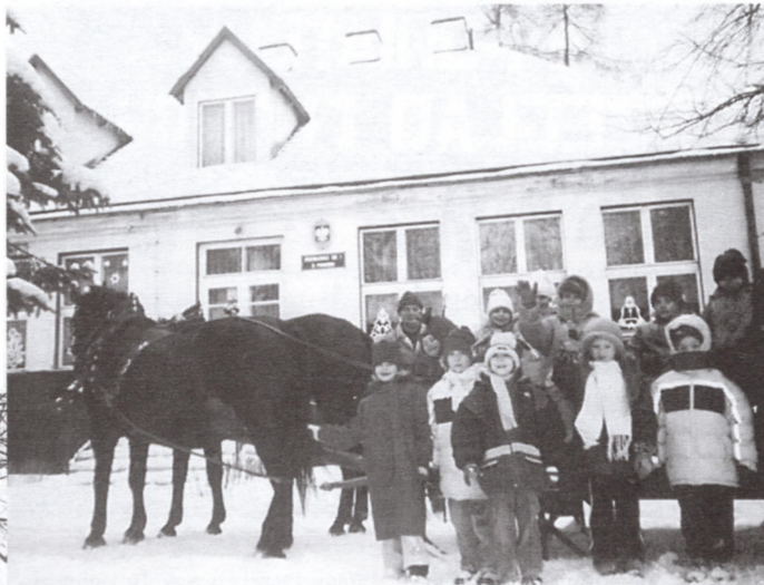
Ośnieżony budynek przedszkola wspaniale wygląda zimą.

za zorganizowanie wspaniałej zimowej przejażdżki kuligiem, która dostarczyła nam niezapomnianych wrażeń!