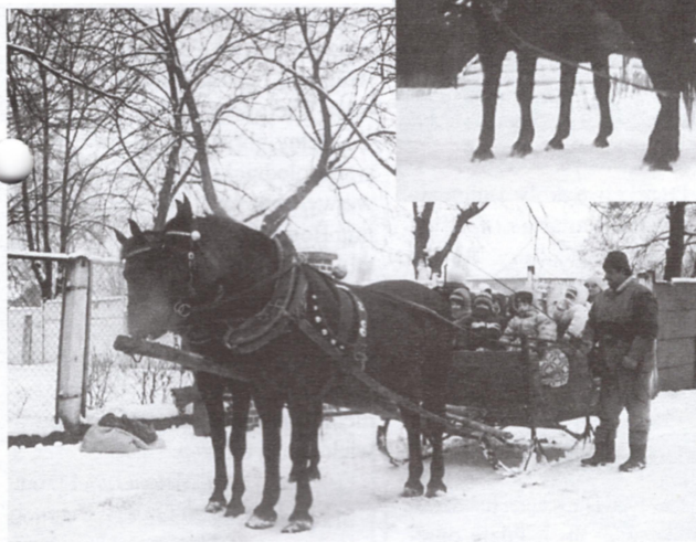
Przedszkolaki wyruszają na kulig.

W pewien śnieżny styczniowy rano pod bramę Przedszkola nr 1 zajechały z fasonem wielkie sanie. Na saniach siedział woźnica w ciepłym kożuchu i futrzanej czapce (jak w bajce). Dzieci od rana czekały na zapowiedzianą niespodziankę, więc gdy usłyszały dźwięk dzwoneczków, ubrały się błyskawicznie i wybiegły, by podziwiać konny zaprzęg - oryginalną uprzęż, złote dzwonki i wspaniałe sanie - tak rzadki już dziś widok.