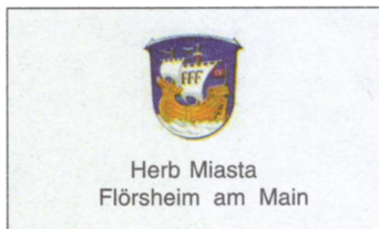
Herb Miasta Flörsheim am Main