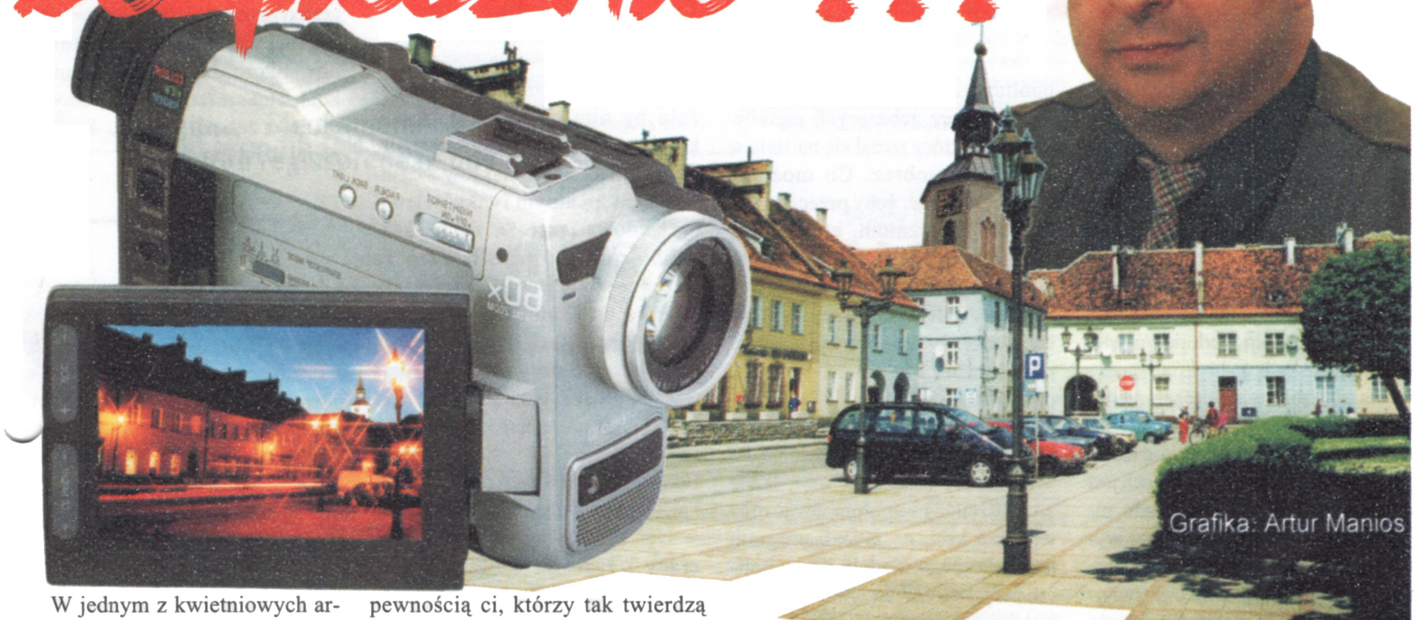
Grafika: Artur Mantos

W jednym z kwietniowych artykułów, który ukazał się w 2000 roku na łamach "Przeglądu Pyskowickiego" pisałem o monitoringu kamerowym jako skutecznej recepty na wandalizm i złodziei grasujących bezkarnie w nocy, okradających sklepy, włamujących się do samochodów, niszczących nasze wspólne mienie. Jakże się myliłem wierząc w to, że będzie zamontowany w newralgicznych punktach miasta oraz, że tym sposobem stawimy chuliganom skuteczny opór. Minęło ponad trzy lata. Mieszkańcy zadają sobie pytanie co z monitoringiem i czy coś się zmieniło w zakresie ładu i porządku na lepsze? Odpowiedź jest bardzo prosta – jest w dalszym ciągu źle, a może i jeszcze gorzej. Na porządku dziennym są dokonywane przestępstwa pospolite i wykroczenia, które zbyt często uchodzą bezkarnie łamiącym prawo.