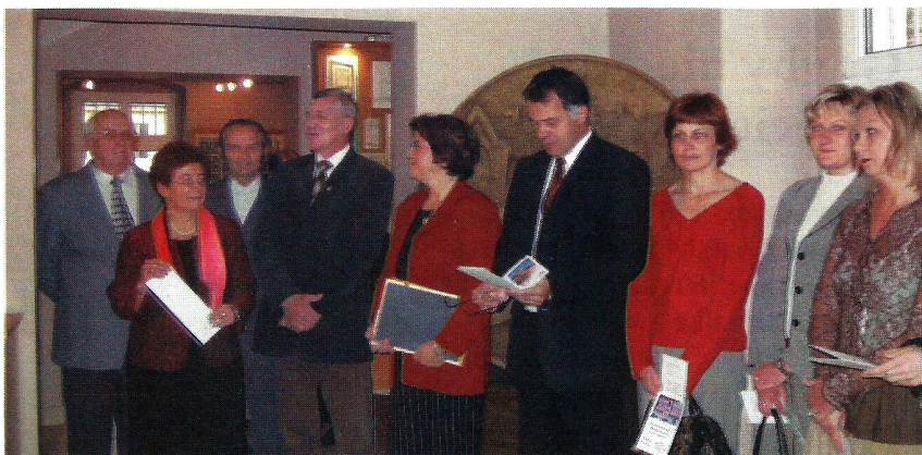
Uroczyste otwarcie wystawy w Muzeum Miejskim w Pyskowicach