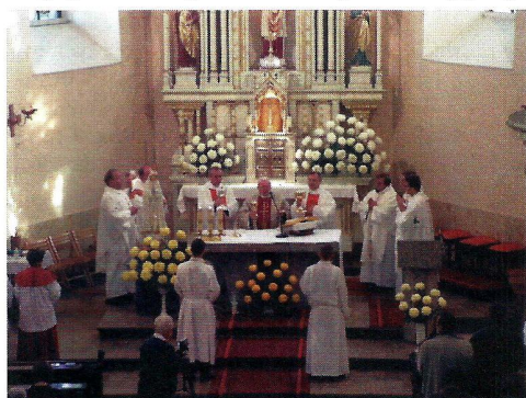
Msza św. w kościele Św. Mikołaja