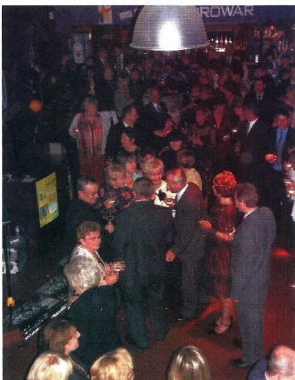
Bankiet rozpoczął się od toastu za pomyślność Liceum, jego pracowników i wychowanków