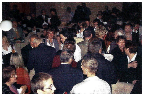
W auli musiało się zmieścić ponad 350 osób