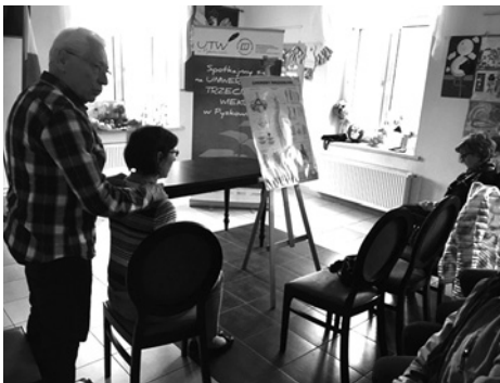
Kurs masażu leczniczego