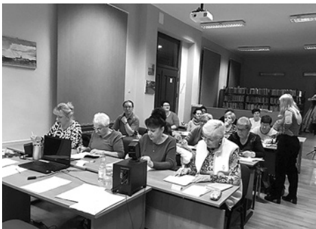
Nauka języków obcych: języka angielskiego i języka niemieckiego