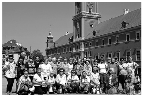
Wycieczki: Wisła i Warszawa oraz tajemnicze labirynty Biblioteki Śląskiej w Katowicach