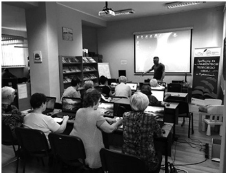
Nauka korzystania z programów komputerowych