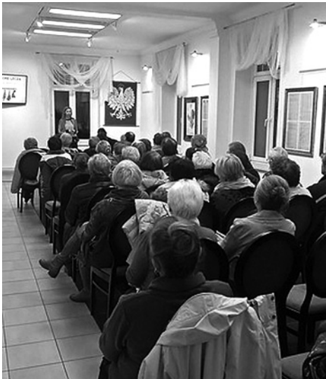
Wykłady m.in. z zakresu prawa, ziołolecznictwa, biologii roślin, zdrowia i dietytyki