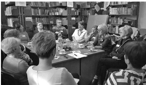
Spotkania Dyskusyjnego Klubu Książki oraz miłośników szachów