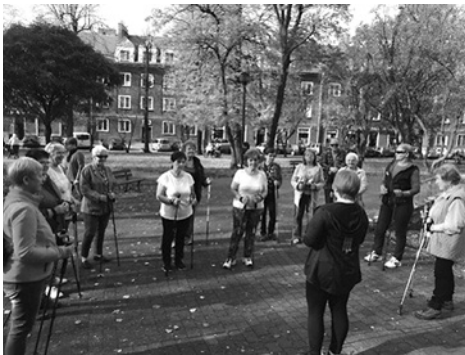
Ćwiczenia promujące i wdrażające ruch dla zdrowia: taniec, pilates, gimnastyka usprawniająca kręgosłup i stawy

Zainteresowanych bardziej szczegółowymi informacjami o działalności pyskowickiego U.T.W. w minionym roku akademickim odsyłamy na stronę internetową Stowarzyszenia: https://mbppyskowice.wixsite.com/utwpyskowice .